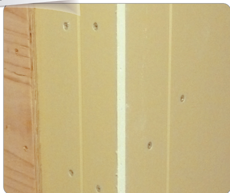
石膏ボードでの施工