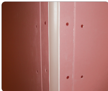
樹脂製品での施工